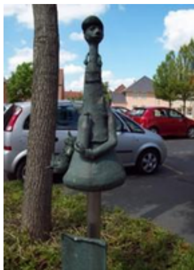
Afbeelding 22: 't Peerke