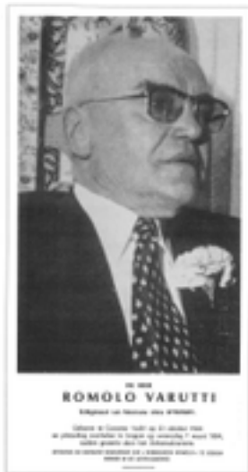
Afbeelding 11: voormalige werkhuizen Romolo