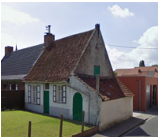
Afbeelding 24: Boerenarbeidershuisje

Op de hoek van de August Vermeylenstraat en de Kerelstraat staat een klein witgekalkt boerenarbeidershuisje. Het dateert wellicht uit de 18e eeuw, de lagere aanbouw aan de kant van de Kerelstraat is wellicht iets later gebouwd.