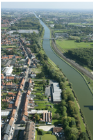
Afbeelding 16: Kanaal Roeselare-Leie