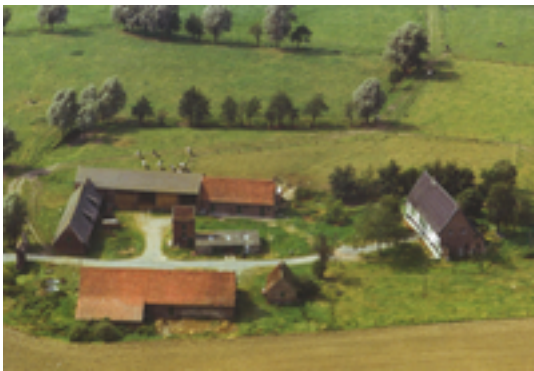
Afbeelding 36: Groot en Klein Ghistelgoed

naam aan de hoeve en aan de beek die nu nog steeds door de gronden stroomt. In 1693 werden de gronden opgesplitst in een Groot Ghistelgoed en een Klein Ghistelgoed.