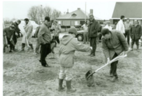
Afbeelding 2: Merelbos

Het Merelbos is een rustig bosje van iets meer dan 5 ha bij de Merelwijk, aan de rand van het dorp. Het terrein is eigendom van de stad Izegem en werd in 1992 aangeplant. Het beheer gebeurt door het Agentschap Natuur en Bos van de Vlaamse Overheid. Bij de aanplanting is gelet op het creëren van verschillende lagen. De hoogste laag bestaat uit bomen zoals berk, es, els en eik. Daaronder vind je struiken zoals sleedoorn, hazelaar en lijsterbes. De struiken zorgen voor een geleidelijke overgang tussen de hoge bomen en de lage kruidlaag en