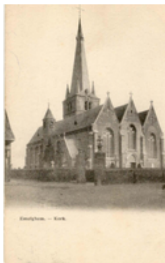
Afbeelding 18: Sint-Pieterskerk