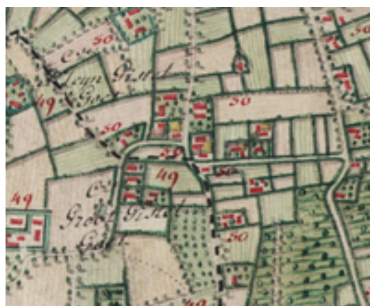
Afbeelding 34: Groot en Klein Ghistelgoed