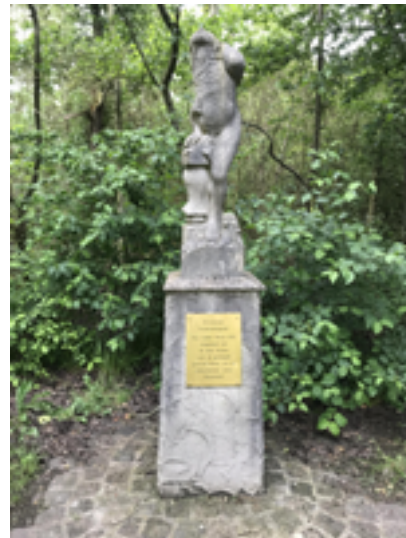
Afbeelding 4: De Bosgod