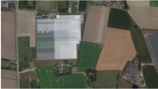
Afbeelding 39: kwekerij Desmet

Deze uitgestrekte serres (50.000 m 2 ) vormen een goed voorbeeld van een hedendaags hoogtechnologisch tuinbouwbedrijf. De familie Desmet – Vandoorne teelde hier sinds 2003 sla in volle grond. In 2012 is men overgeschakeld op hydrocultuur. De kleine plantjes worden met een robot netjes uitgeplant in opeenvolgende goten. Naarmate de plantjes groeien, gaan de goten uiteen om de planten meer plaats te geven. Het groeiveld met de goten is volledig op manhoogte gebracht, zodat het ergonomischer werken is.