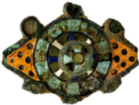
Afbeelding 6: De 1200