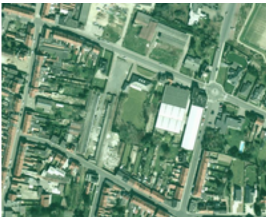
Afbeelding 12: voormalige werkhuizen Romolo

Op deze percelen, tussen de Baronstraat en de