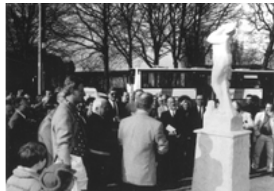
Afbeelding 5: De Bosgod