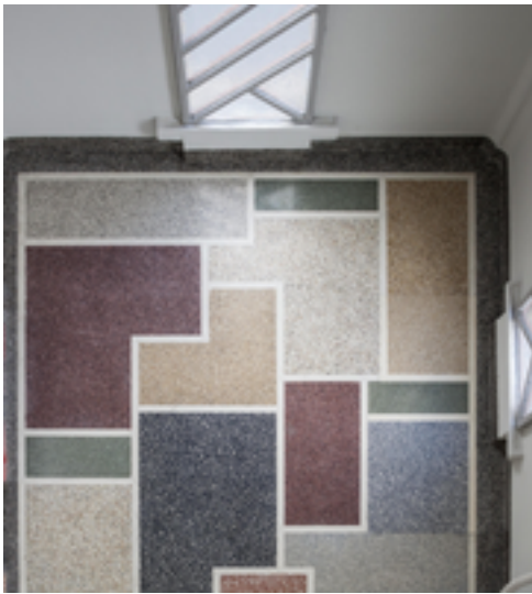
Afbeelding 10: voormalige werkhuizen Romolo