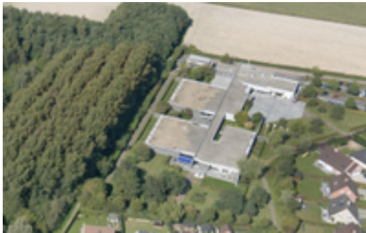
Afbeelding 3: 't Venster

't Venster is een centrum dat gespecialiseerd is in de zorg en ondersteuning voor volwassenen met een niet-aangeboren hersenletsel (NAH) met inbegrip van de neurodegeneratieve aandoeningen. De mannen en vrouwen die gebruik maken van de zorg en ondersteuning van 't Venster, hebben dus allemaal iets meegemaakt: een ongeval, een hartstilstand of hersenbloeding, of een ziekte waardoor ze meer hulp en ondersteuning nodig hebben.