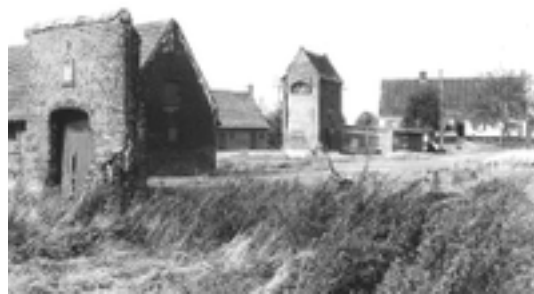
Afbeelding 32: Groot en Klein Ghistelgoed

Ten westen van de huidige Haaipanderstraat bevond zich zeker al in de 17e eeuw een grote omwalde hoeve met landerijen. Deze gronden waren ooit eigendom geweest van de Heren van Gistel - een oud adellijk geslacht. De adellijke familie leende haar