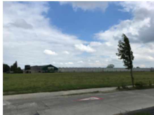
Afbeelding 40: laaggelegen weiden

In dit gebied ten noorden van Emelgem bestaat de bodem uit zandleem en – vooral in de buurt van de Gistelbeek – uit klei. Kleigronden zijn zwaarder om te bewerken voor de landbouw, en worden daarom vaak gebruikt als weide.