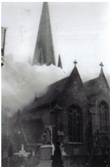
Afbeelding 20: Sint-Pieterskerk