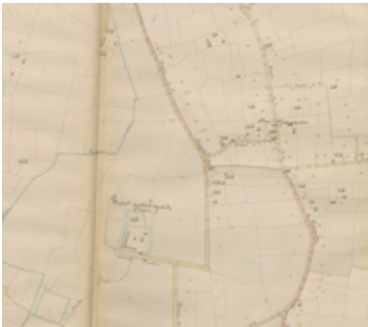
Afbeelding 35: Groot en Klein Ghistelgoed