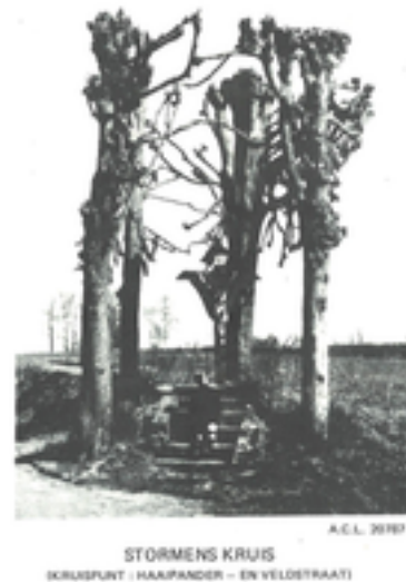
Afbeelding 38: Stormens Kruis

Een laat 19e-eeuws gietijzeren Christusbeeld hangt aan een houten kruis. De naam verwijst naar de familie Storme, die eigenaar was van een nabijgelegen hoeve. In 1894 verklaarde Mgr. Debrabandere - de toenmalige bisschop van Brugge - dat iedereen die vijf Onze Vaders en vijf Weesgegroetjes bad bij dit kruis, daarmee een aflaat van veertig dagen verdiende. Veertig dagen strafvermindering in het hiernamaals, dus.