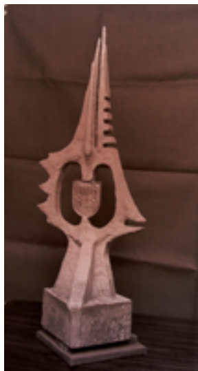
Afbeelding 13: Hoop op de Toekomst