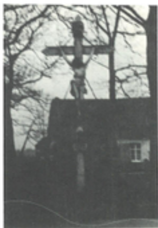
VANMARCKENS KRUIS (MÉHELSTRAAT)