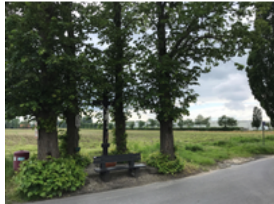
Afbeelding 37: Stormens Kruis