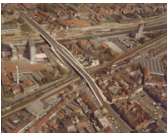
Afbeelding 17: Kanaal Roeselare-Leie

aan de Leie. Arbeiders werkten 9 jaar lang om het 16,5 km lange kanaal met de hand uit te graven: in 1872 kon het eerste schip varen van de Leie tot in Roeselare.