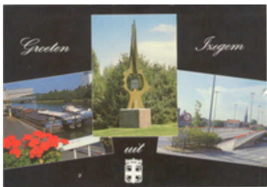
Afbeelding 14: Hoop op de Toekomst

echter een nog ouder document uit 1066, waarin de naam Izegem (Isinghehem) opduikt. De viering voor 900 jaar Izegem kwam dus 14 jaar te laat! Men heeft het kunstwerk echter nooit meer aangepast.