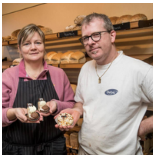
Afbeelding 23: 't Peerke