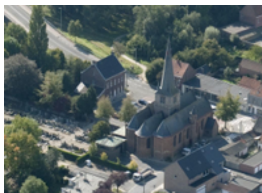
Afbeelding 19: Sint-Pieterskerk