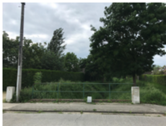
Afbeelding 29: Gistelbeek

De Gistelbeek is vernoemd naar de Heren van Gistel, een oud adellijk geslacht dat in de middeleeuwen hier heel wat gronden bezat. De Gistelbeek stroomt af naar de Mandel ter hoogte van Ingelmunster. Tot enkele jaren geleden was dit deel ten noorden van