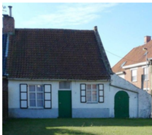
Afbeelding 26: Boerenarbeidershuisje

Zowel de August Vermeylenstraat als de Kerelstraat heetten vroeger anders.