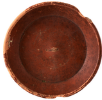
Afbeelding 8: De 1200

In 1893 stootte men tijdens grondwerken hier niet ver vandaan, ten noordwesten van het kruispunt