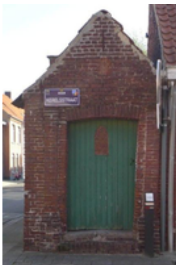
Afbeelding 27: Callewaerts kapel