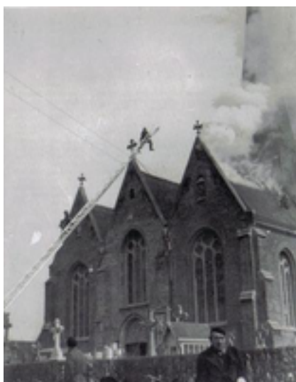
Afbeelding 21: Sint-Pieterskerk

In de 2e helft van de 13e stond hier al een vroeggotische kruisvormige kerk in natuursteen. Daarvan zie je onder meer nog overblijfselen in de sokkel van de kerkmuren en in het midden van de westgevel. Deze kerk werd in de 15e eeuw uitgebouwd tot een laatgotische driebeukige hallenkerk – dus met 3 even hoge beuken. In 1566 werd de kerk eerst geplunderd en daarna grotendeels door brand verwoest tijdens de Beeldenstorm. In de eerste helft van de 17e eeuw bouwden de Emelgemnaren de verwoeste kerk weer op zoals ze er voordien uitzag. In de 18e en 19e eeuw werd de kerk uitgebreid met een sacristie en onderging het interieur een volledige herinrichting in classicistische stijl. Na grote – en neogotisch geïnspireerde - herstellingswerken aan het einde van