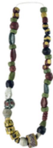
Afbeelding 7: De 1200

Het stuk grond waarop nu kleuterschool De Knuffel staat heette vroeger "de 1200". Die benaming verwijst naar een oude Vlaamse oppervlaktemaat: het stuk grond was ongeveer "1200 lands groot". Voor de kenners: een "lands" is een synoniem voor een "Kortrijkse roede". 1200 lands / 1200 Kortrijkse roede komt overeen met ongeveer 10.620 m 2 , dus net iets groter dan 1ha.