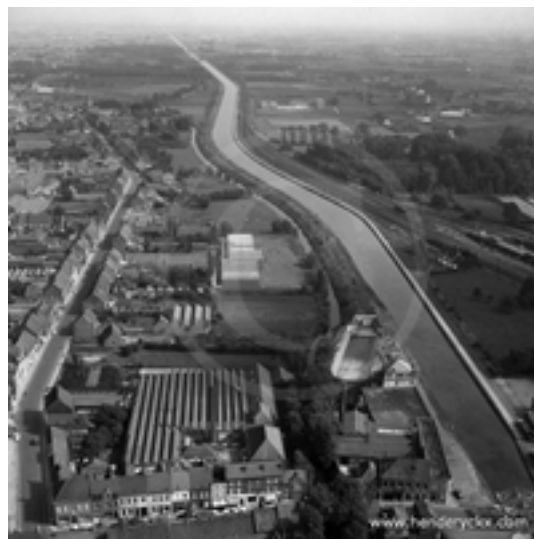
Afbeelding 15: Kanaal Roeselare-Leie

Midden 19e eeuw zocht men naar manieren om deze streek beter economisch te ontwikkelen en beter te verbinden met de rest van het land. In 1847 opende al een spoorlijn tussen Brugge en Kortrijk, met een halte in Izegem. De rivier de Mandel stroomde al van Roeselare naar de Leie, maar was niet altijd even bevaarbaar en trad vaak buiten haar oevers. In 1863 ging de eerste spade in de grond voor het graven van een kanaal van Roeselare tot