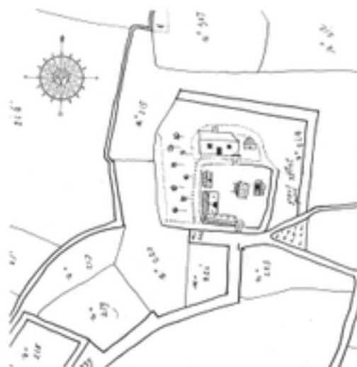
Afbeelding 33: Groot en Klein Ghistelgoed