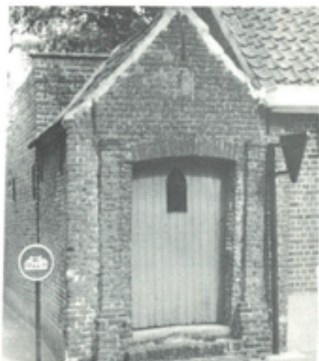
Afbeelding 28: Callewaerts kapel

werd gebouwd in opdracht van de kinderen en weduwe van de toen overleden Pieter van Meenen. Het kapelletje kreeg later de naam "Callewaerts kapel", omdat het onderhouden werd door een lid van de familie Callewaert, die toen vlak naast de kapel woonde.