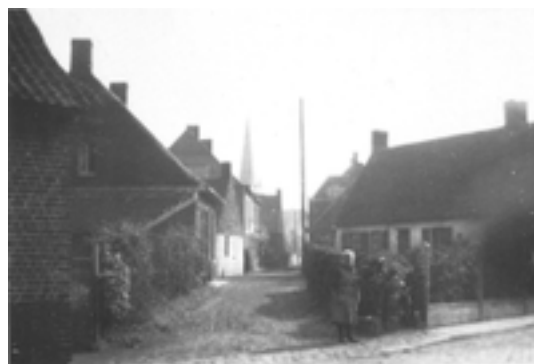
Afbeelding 25: Boerenarbeidershuisje

Op de hoek van de August Vermeylenstraat en de Kerelstraat staat een klein witgekalkt boerenarbeidershuisje. Het dateert wellicht uit de 18e eeuw, de lagere aanbouw aan de kant van de Kerelstraat is wellicht iets later gebouwd.