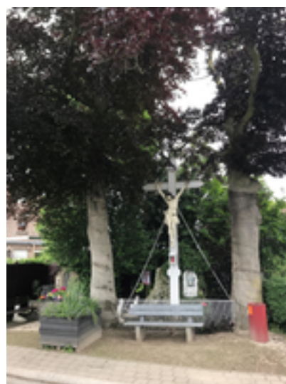
Afbeelding 30: Neyrincks kruis

Op de hoek van de Merelstraat en de Haaipanderstraat staat een groot wit ijzeren kruis met een gekruisigde Christus, met daaronder het opschrift "Mijn Jezus Bermhertheid". Achter het kruis is een kleine Lourdesgrot gebouwd, links staat een klein Mariakapelletje uit 1988. Dit kruis heeft doorheen de jaren al verschillende namen gehad, telkens verbonden aan de naam van de personen