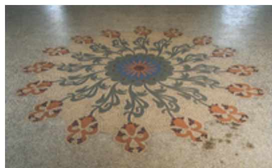
Afbeelding 9: voormalige werkhuisen Romolo