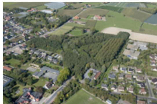
Afbeelding 1: Merelbos