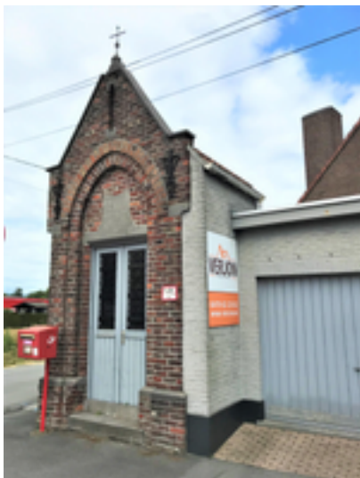
Afbeelding 34: Kruipeandaarde

echter berouw. Hij liet de kapel bouwen en 'kroop' volgens de legende elke dag op zijn knieën 'door de aarde' naar de kapel.