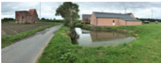
Afbeelding 12: Leeghof

De naam van de historische hoeve 'Leeghof' verwees naar de locatie; we bevinden ons hier namelijk op één van de laagste punten van Kachtem. De hoeve kreeg haar naam om de tegenstelling te maken met 't Hoge, het hoger gelegen deel van het dorp. De historische hoeve Leeghof is vandaag verdwenen, maar een deel van de oude omwallingen zijn nog bewaard. In het veld tegenover de hoeve staat ook nog steeds een oude ast (droogoven).