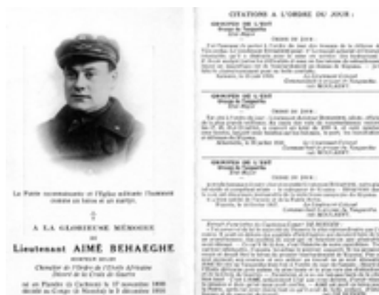
Afbeelding 29: Aimé Behaeghestraat

De Aimé Behaeghestraat is een heel gewone, bijna saaie, straat in een rustige woonwijk. Het verhaal van de man naar wie de straat vernoemd is, leest echter als een onvervalste avonturenroman!