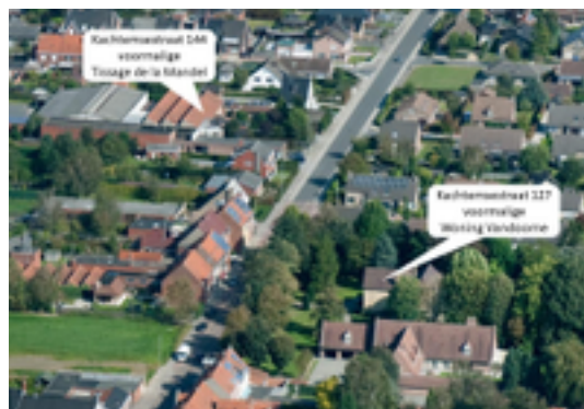
Afbeelding 40: voormalige weverij 'Tissage de la Mandel'