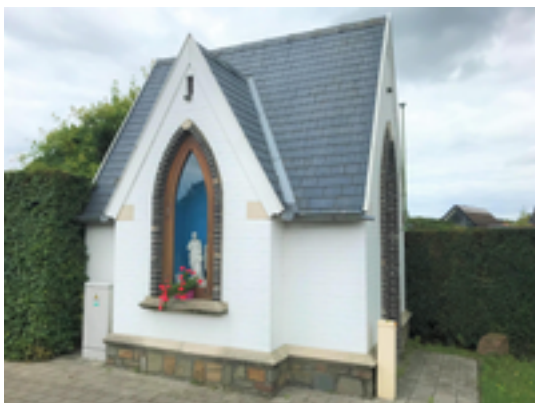
Afbeelding 39: Historische hoeves Vanneste & Verhelle

bewaard die wijst op toenmalige verbouwingen. De familie Beeuwsaert –