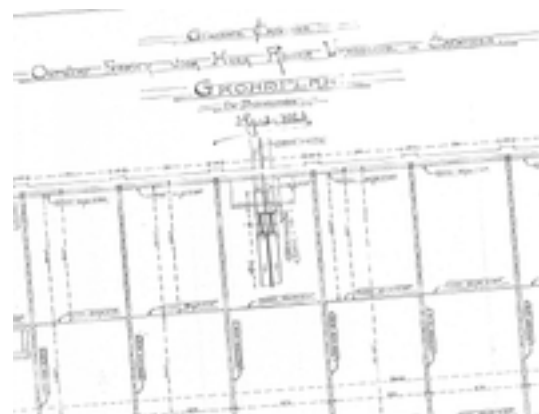
Afbeelding 42: voormalige weverij 'Tissage de la Mandel'