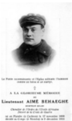
Le Père commémoré en l'Église est le lieutenant Aimé BEHAEGHE A LA GLOIREUSE MÉMOIRE du Lieutenant AIME BEHAEGHE mort pour la Patrie Chasseur de l'armée de l'Est le 17 novembre 1916 à la bataille de la Somme