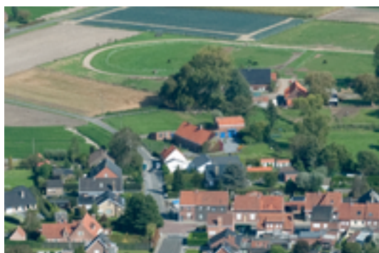
Afbeelding 36: Historische hoeves Vanneste & Verhelle

De oude hoeves in de Vageweenstraat 10 en 8 gaan zeker terug tot halweg de 19e eeuw en wellicht nog vroeger.