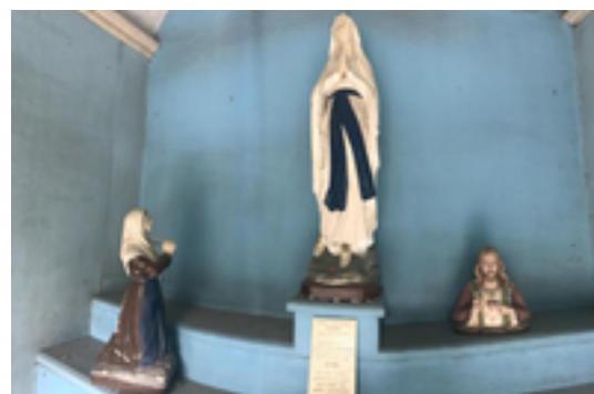
Afbeelding 14: Veldkapelletje

Dit verweerde veldkapelletje uit rode baksteen dateert uit het einde van de 19e eeuw. Boven in de gevel prijkt het opschrift "O.L.V. van Lourdes B.V.O.". Het spitsboogportaal is geflankeerd door twee pilasters met summier kapiteeltje. Het interieur is bepleisterd en beschilderd. Achter een smeedijzeren traliehek zie je een beeld van de Maagd Maria, aanbeden door de H. Bernadette. Dit duo zullen we later op de wandeling nog tegenkomen.