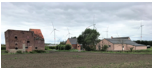
Afbeelding 11: Leeghof