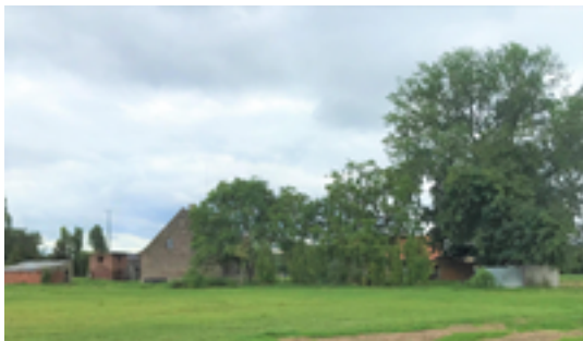
Afbeelding 38: Historische hoeves Vanneste & Verhelle