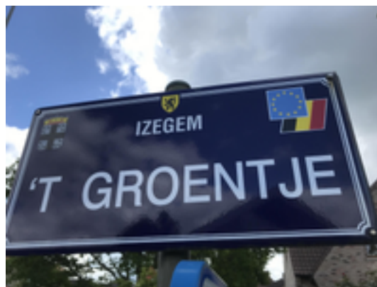
Afbeelding 28: 't Groentje

't Groentje is de volksnaam voor een stukje van de Muynckswalbeek, die hier naar de Mandel kronkelt. De beek start op het hoogste punt van Kachtem. 't Groentje is een mooie en noodzakelijke groencorridor omwille van de waterbuffering. De beek is gedeeltelijk ingekokerd maar komt hier en daar toch vrolijk aan de oppervlakte en zorgt zo voor een aangename groenzone in deze recente aangelegde wijk. Je kan het hele stuk door dit stukje groen wandelen. Soms ga je daarbij door grasveldjes - en die kunnen al eens drassig zijn bij nat weer!