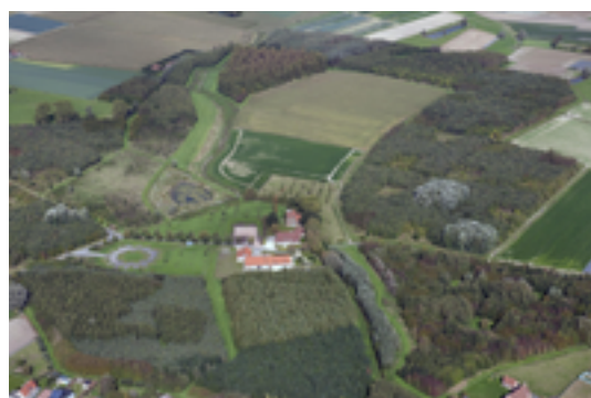
Afbeelding 20: Rhodesgoed

Een deel van het grondgebied van Kachtem behoorde tot de heerlijkheid van de familie Rode. De hoeve waar vandaag een horecazaak in gehuisvest is, was de voornaamste hoeve van de heerlijkheid. De heerlijkheid van Rode had verder nog eigendommen in Rumbekke, Oekene, Sint-Eloois-Winkel, Roeselare, Hooglede en Izegem.