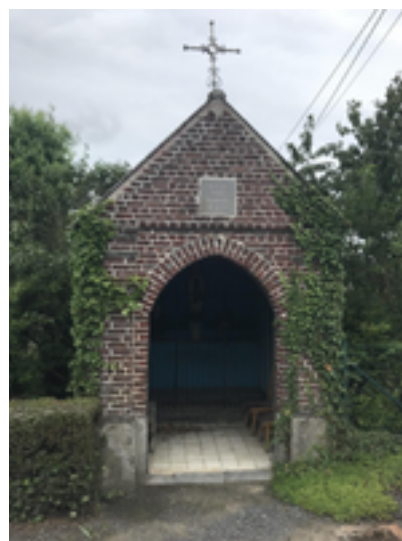
Afbeelding 13: Veldkapelletje