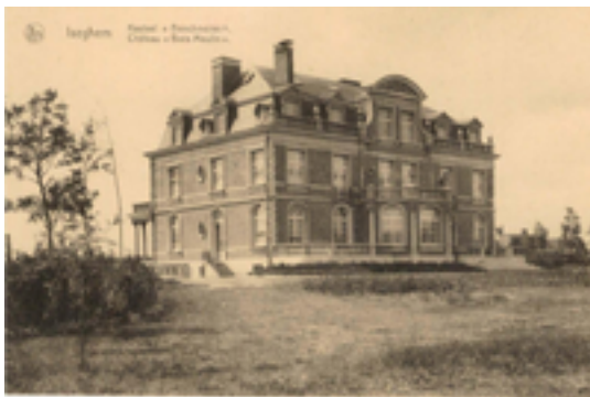
Afbeelding 15: Provinciedomein Wallemote-Wolvenhof