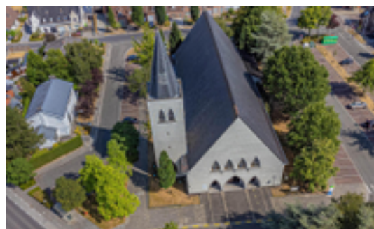
Afbeelding 1: Heilige Familiekerk