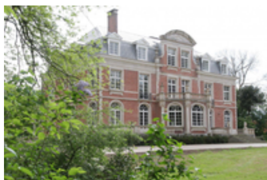
Afbeelding 14: Provinciedomein Wallemote-Wolvenhof

Dit provinciaal domein is vernoemd naar de twee