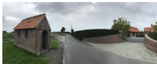
Afbeelding 27: Scheemaekerskapel

Deze kleine kapel is opgericht in opdracht van de gezusters Descheemaeker in 1896 - het jaartal is nog af te lezen op een arduinen steen in de gevel. De familie Descheemaeker bewoont jarenlang de historische hoeve aan de overzijde van de straat. Net als de hoeve Hoge Schuur en de hoeve Mosscher