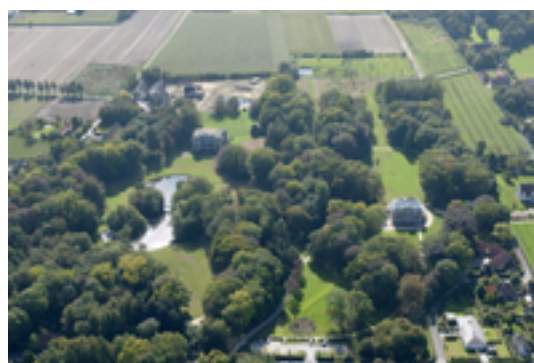
Afbeelding 13: Provinciedomein Wallemote-Wolvenhof