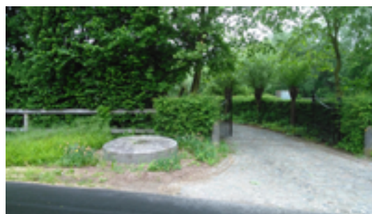
Afbeelding 8: kantsteen