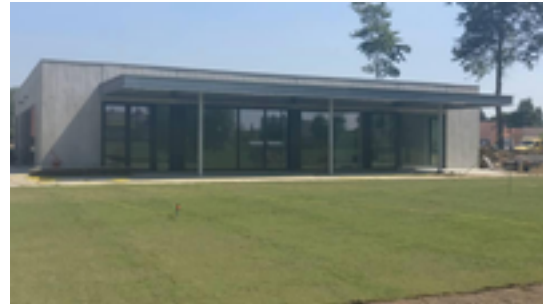
Afbeelding 30: buurtgebouw Molenwiek

De Bosmolens is een levendige buurt van Izegem en beschikt sinds 2017 over een nieuw buurtgebouw: "Molenwiek". Het polyvalente gebouw is voorzien voor allerlei vormen van wijkwerking: het kan gehuurd worden door burgers en verenigingen, er vinden allerlei sociale, culturele en sportieve activiteiten in plaats, in de schoolvakanties is er speelpleinwerking, enzovoort. Bij het gebouw is ook een aangename groenzone aangelegd.