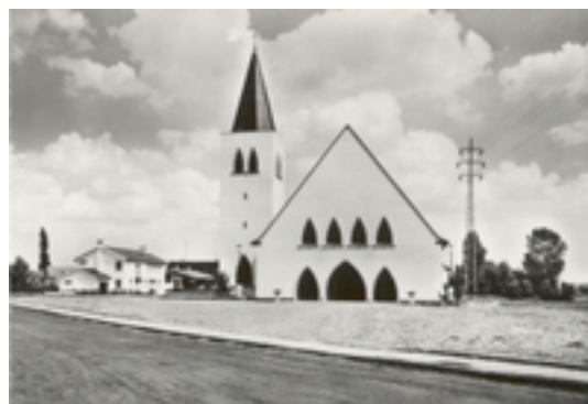
Afbeelding 2: Heilige Familiekerk

Deze kerk is ontstaan als derde parochiekerk van Izegem. De andere twee parochies, Sint-Tillo en Heilig