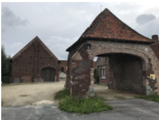
Afbeelding 25: Hoeve de Hoge Schuur

Deze hoeve wordt al in de 17e eeuw vermeld op het