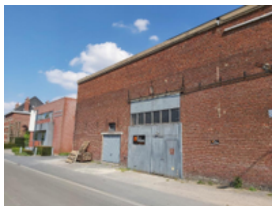
Afbeelding 22: voormalig vlasbedrijf Demeulenaere

De Bosmolens heeft een groot vlas-verleden: op een boogscheut van elkaar bevonden zich hier maar liefst acht vlas- en roterijbedrijven! De schuren en de rootputten zijn vaak tot op de dag van vandaag bewaard, want betonnen rootputten zijn immers niet makkelijk te slopen. De schuren kregen ondertussen een nieuwe bestemming.