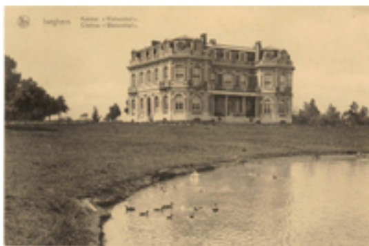
Afbeelding 16: Provinciedomein Wallemote-Wolvenhof