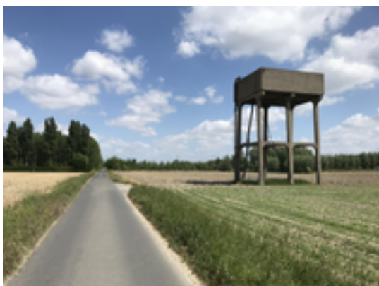
Afbeelding 10: Watertoren Verenigde Roters