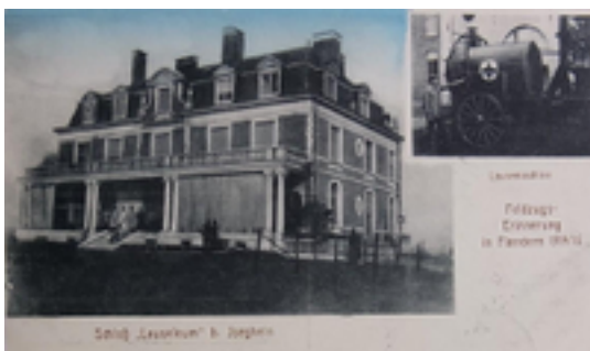
Afbeelding 17: Provinciedomein Wallemote-Wolvenhof