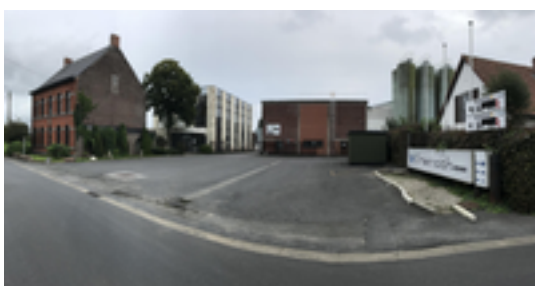
Afbeelding 7: Fremach

Fremach is een Europees leverancier van complexe en innovatieve kunststof- en elektronicaonderdelen voor de auto-industrie. Het bedrijf stelt vandaag bijna 1.000 mensen te werk in haar vestigingen in Frankrijk, Tsjechië en Slowakije. De oorsprong van deze multinational ligt echter hier op de Bosmolens. Hier op deze plaats was tot in de jaren 1960 het