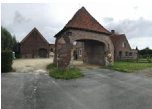
Afbeelding 23: Hoeve de Hoge Schuur