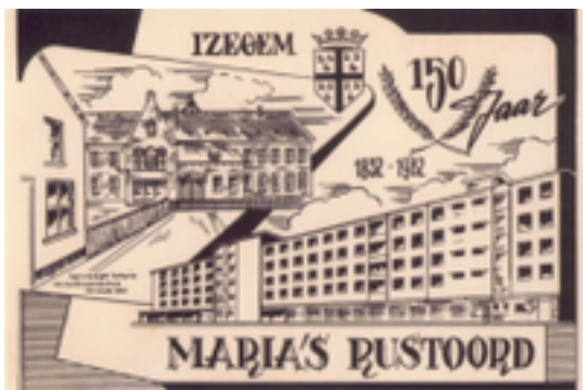
Afbeelding 20: Woon- en Zorgcentrum De Plataan