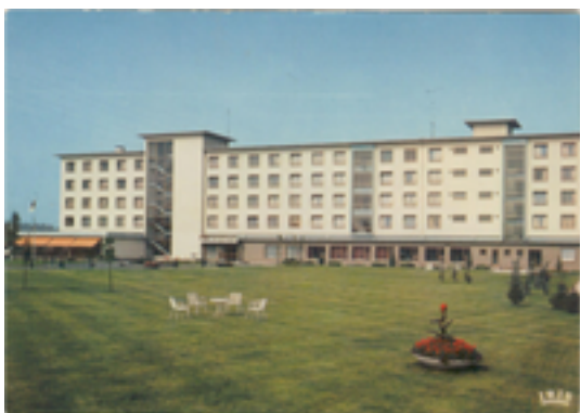
Afbeelding 19: Woon- en Zorgcentrum De Plataan