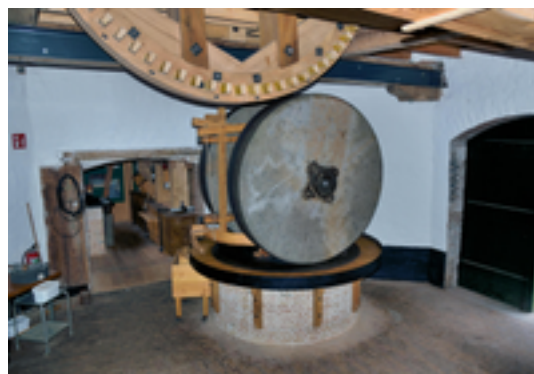
Afbeelding 9: kantsteen

De wijk "De Bosmolens" dankt zijn naam aan drie verdwenen historische windmolens. Deze molensteen is nog een fysiek overblijfsel van die molens. Het is een zogenaamde "kantsteen". Deze molensteen draaide ooit rechtop op een platte steen of plaat in een molen. De steen draaide dus verticaal, op zijn kant. Je kan een kantsteen herkennen omdat er meestal een vierkant gat in zit en omdat de zijkanen van de steen geen groeven hebben. Kantstenen werden niet zozeer gebruikt om graan te malen, maar wel om lijnolie te persen uit lijnzaad.