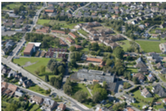
Afbeelding 18: Woon- en Zorgcentrum De Plataan