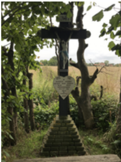
Afbeelding 29: Verloo's Kruis