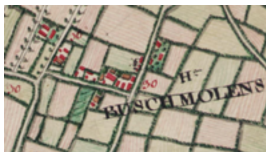
Afbeelding 5: Hoeve De Blauwpanne