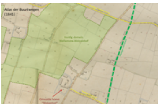
Afbeelding 4: Duiventoren hoeve Wolvenhof

Deze hoeve "Wolvenhof" was oorspronkelijk een omwalde hoeve en bestond al midden 18e eeuw. De hoeve heeft zijn naam gegeven aan één van de twee