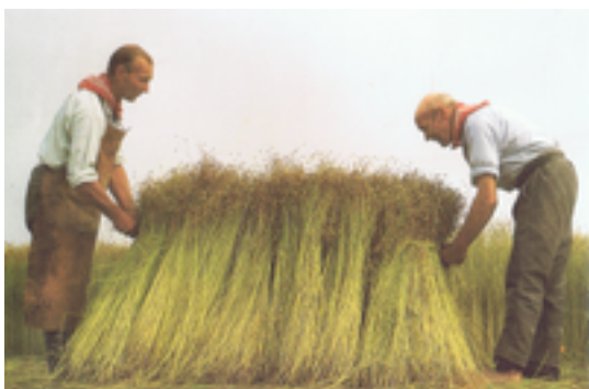
Afbeelding 11: Watertoren Verenigde Roters