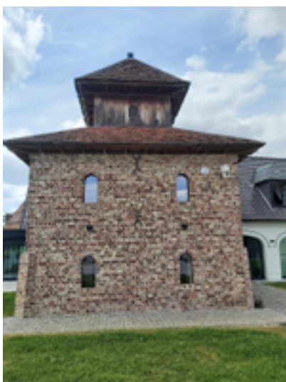
Afbeelding 3: Duiventoren hoeve Wolvenhof