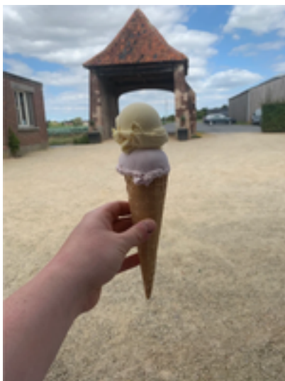
Afbeelding 24: Hoeve de Hoge Schuur