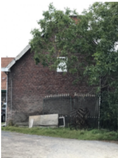
Afbeelding 6: Hoeve De Blauwpanne

Op de Bosmolens bevinden zich verschillende hoeves, die zijn opgenomen in een provinciale databank van merkwaardige hoevegebouwen. Hoeve De Blauwpanne is er één van. De oudste vermelding van de hoeve gaat terug tot 1653. De benaming verwijst naar de uitzonderlijke dakbedekking voor een boerenwoning: met dakpannen in plaats van met stro. De huidige hoeve is doorheen de jaren zwaar verbouwd en niet publiek toegankelijk. Binnen in het woonhuis is op de haardbalk nog steeds een 19e-eeuwse spreuk bewaard: Wie werkt en spaart - versterkt en vergaart.