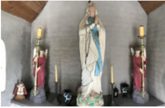
Afbeelding 28: Scheemaekerskapel

Ambacht is deze hoeve Descheemaeker ooit omweld geweest, én stond er een cichorei-ast. De omwalling en cichorei-ast zijn echter verdwenen. De gerestaureerde hoeve is wel nog steeds bewoond door een afstammeling van de familie Descheemaeker.