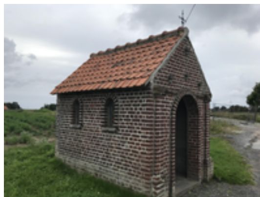
Afbeelding 26: Scheemaekerskapel