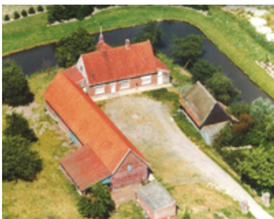
Afbeelding 21: Woon- en Zorgcentrum De Plataan

vroegere Maria's Rustoord en het revalidatiecentrum Ten Bos. De Plataan bevindt zich op de gronden van de vroegere "Dischhoeve". De Dischhoeve was eigendom van de Izegemse armendis, de instelling voor armenzorg. De voedingswaren die de hoeve opbracht, kwamen ten goede van de armen. De armendis is dus een verre voorloper van het huidige OCMW.