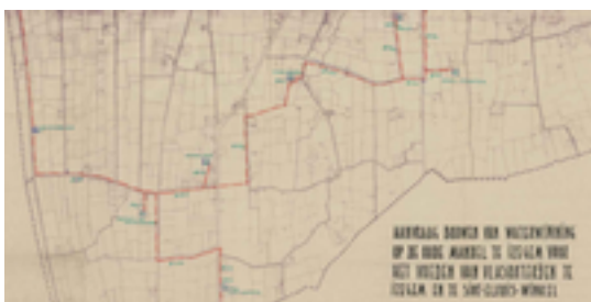
Afbeelding 12: Watertoren Verenigde Roters

Deze betonnen watertoren werd eind de jaren 1950 gebouwd door de "Verenigde Roters", een groep van 12 vlasbedrijven uit de Bosmolens en Sint-Eloois-Winkel.