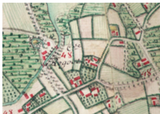
Afbeelding 19: Rhodesgoed