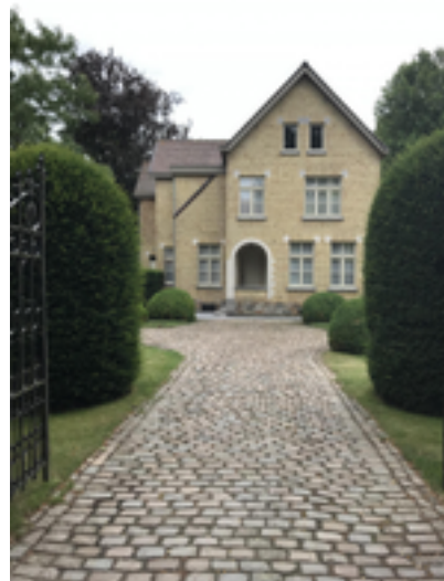
Afbeelding 37: voormalige weverij 'Tissage de la Mandel'

De hoeve Verhelle, Vageweenstraat 8, ligt een stukje lager dan het straatniveau. Op oude kaarten, zoals de Atlas der Buurtwegen uit 1841, is te zien dat de hoeve vroeger volledig was omwald.