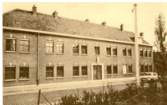
Afbeelding 23: 't Hoge

Deze buurt van Kachtem heet dan wel 't Hoge maar