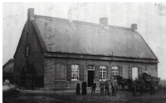
Afbeelding 18: Rhodesgoed