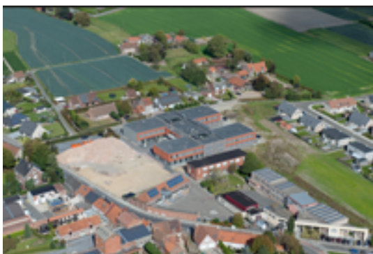
Afbeelding 22: 't Hoge

Deze buurt van Kachtem heet dan wel 't Hoge maar