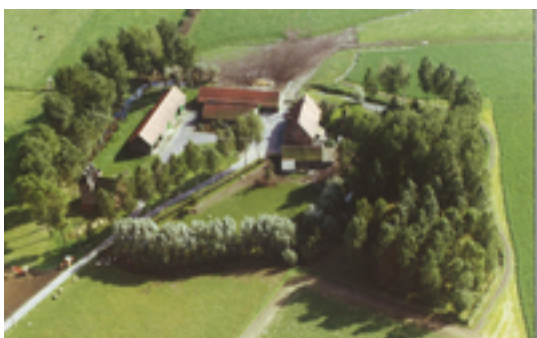
Afbeelding 17: Meseghemgoed

doorwandelt, bots je zowat op de autostrade E403 / A17 van Doornik naar Brugge. Op deze plaats bevond zich vroeger de heerlijkheid Meseghem. Dit was een uitgestrekt grootgrondbezit van 80 hectare, dat eerst toebehoorde aan de heren van Izegem en daarna aan de prinselijke familie d'Arenberg. De autostrade snijdt vandaag dwars door die verdwenen heerlijkheid. Bij de aanleg van de autostrade in de jaren 1970-1980 gebeurde een grenscorrectie tussen Roeselare en Izegem. Alles wat ten westen van de autoweg kwam te liggen, werd grondgebied Roeselare. Alles ten oosten van de autoweg hoorde voortaan bij Izegem. Het Mezegemgoed, de hoeve van de verdwenen heerlijkheid, kwam ten westen van de autostrade te liggen, in Roeselare. De hoeve werd in 2014 grotendeels gesloopt om plaats te maken voor de bouw van een windturbine - meerbepaald: de