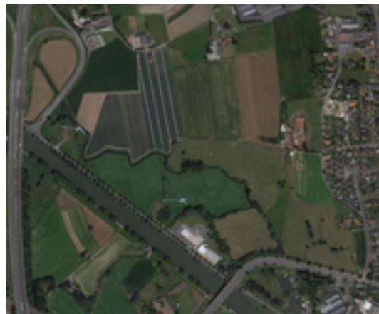
Afbeelding 7: meanderende Mandel

In deze velden tussen het dorp Kachtem en de autostrade is het overstromingsgebied van de Mandel nog grotendeels bewaard. Men spreekt van