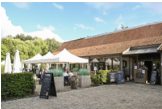
Afbeelding 21: Rhodesgoed

Het Rhodesgoed en de Rhodesbeek die door het natuurgebied stroomt hebben niets te maken met de kleur 'rood', maar verwijzen naar de familienaam van de oorspronkelijke eigenaars. Toch ontstond in de loop van de jaren het misverstand dat de kleur rood er iets mee te maken had. De mascotte van Kachtem, een reus, kreeg zelfs de naam 'Jan-Pieter de Rosten' (de roodharige).