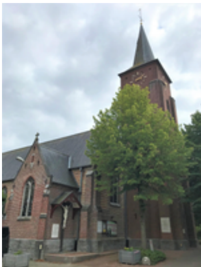
Afbeelding 3: Sint-Jan de Doper-kerk

beschermheilige kozen, in plaats van voor de 'reguliere' borstelmakerspatroon Sint-Antonius. Vandaag kan je de Ommegang rond de kerk nog altijd zelf ondernemen. Vergulde bas-reliëfs met tafereel uit het leven van Sint-Jan de Doper wijzen je de weg. De zeven staties uit 1991 werden bekostigd door Kachtemse families. Hun namen staan telkens vermeld onderaan het tafereel.