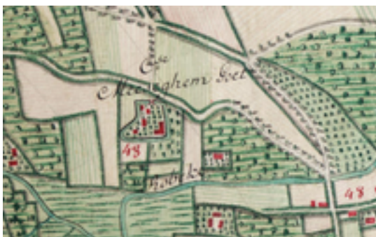
Afbeelding 16: Meseghemgoed