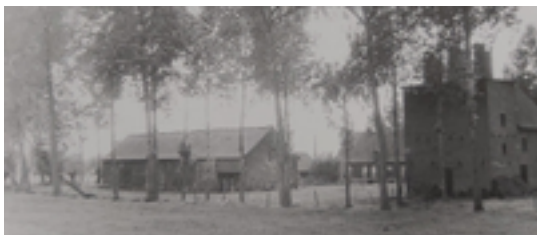
Afbeelding 15: Meseghemgoed