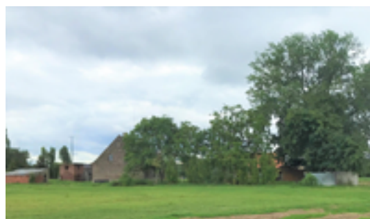
Afbeelding 33: Historische hoeves Vanneste & Verhelle

't Groentje is de volksnaam voor een stukje van de Muynckswalbeek, die hier naar de Mandel kronkelt. De beek start op het hoogste punt van Kachtem. 't Groentje is een mooie en noodzakelijke groencorridor omwille van de waterbuffering. De beek is gedeeltelijk ingekokerd maar komt hier en daar toch vrolijk aan de oppervlakte en zorgt zo voor een aangename groenzone in deze recente aangelegde wijk. Je kan het hele stuk door dit stukje groen wandelen. Soms ga je daarbij door grasveldjes - en die kunnen al eens drassig zijn bij nat weer!