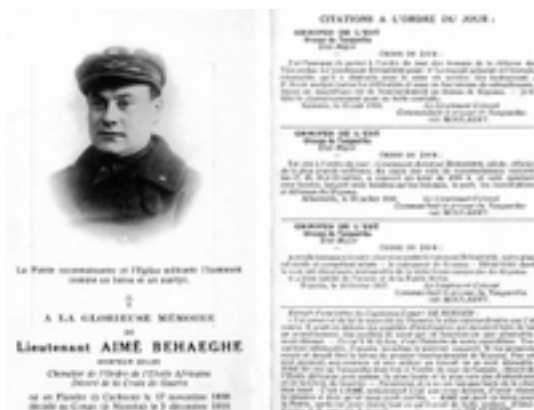
Afbeelding 26: Aimé Behaeghestraat

De Aimé Behaeghestraat is een heel gewone, bijna saaie, straat in een rustige woonwijk. Het verhaal van de man naar wie de straat vernoemd is, leest echter als een onvervalste avonturenroman!