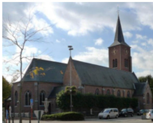
Afbeelding 1: Sint-Jan de Doper-kerk