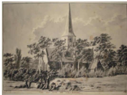
Afbeelding 2: Sint-Jan de Doper-kerk

Deze neogotische kerk gewijd aan Sint-Jan de Doper heeft roots tot in de 12e eeuw. Sedert de 17e eeuw is er een Ommegang. Eerst ging het vooral om een bedevaart met aanbidding van Sint-Jan voor hoofd- en keelziekten, epilepsie en kinderstuipen. Deze bedevaart kende een enorme boost halfweg de 18e eeuw omdat de kerk vanaf dan relikwieën van Sint-Jan bewaarde. Geleidelijk groeide de bedevaart uit tot een echt volksfeest op 24 juni, de geboorte- en feestdag van de heilige. Het feest trok mensen vanuit de wijde omtrek aan en viel zodanig in de smaak dat de borstelmakers van Izegem voor Sint-Jan als