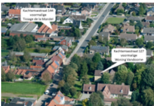
Afbeelding 35: voormalige weverij 'Tissage de la Mandel'