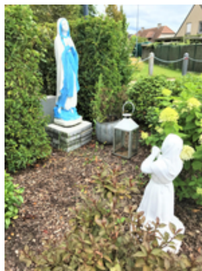
Afbeelding 25: 't Hoge

is net niet het hoogste punt van Kachtem. Deze buurt werd in de volksmond zo genoemd om een onderscheid te maken met het eigenlijke, lager gelegen centrum van het dorp - het dorpsplein waar de wandeling startte. Op 't Hoge bouwde men een rustoord, een klooster, een weeshuis en een school - allemaal op de gronden en in het huis van een Kachtemse weldoener Julien Vanneste. Dit project was zeer tegen de zin van Kachtems pastoor Cool, die vreesde dat zijn bestaande school in het centrum zou