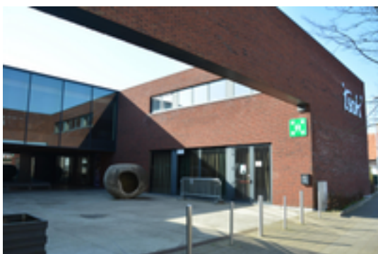
Afbeelding 4: 't SOK

Sedert 2008 beschikt Kachtem over een modern complex waar sport en cultuur mogelijk is. Het