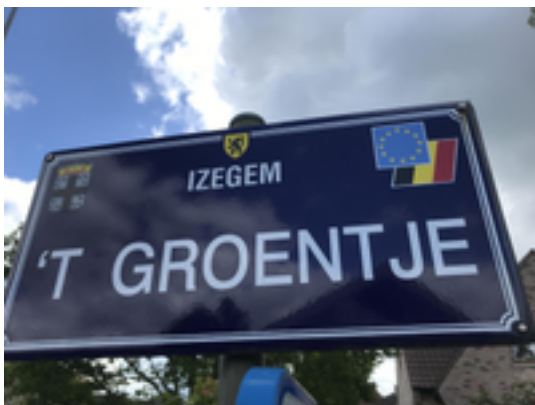
Afbeelding 30: 't Groentje