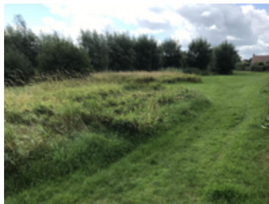
Afbeelding 28: 't Groentje