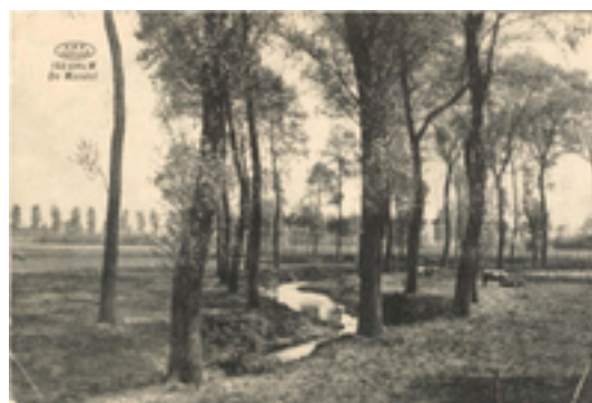
Afbeelding 8: meanderende Mandel