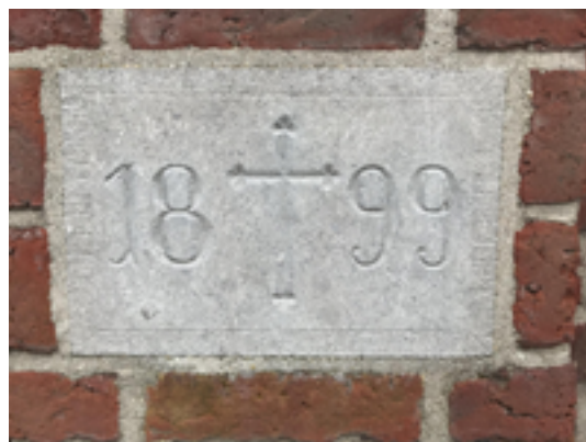
Afbeelding 24: 't Hoge