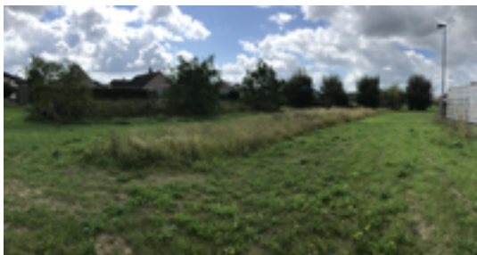
Afbeelding 29: 't Groentje