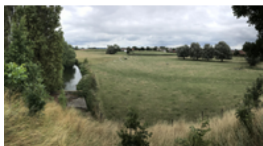
Afbeelding 10: meanderende Mandel