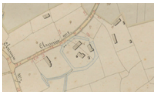
Afbeelding 32: Historische hoeves Vanneste & Verhelle

't Groentje is de volksnaam voor een stukje van de Muynckswalbeek, die hier naar de Mandel kronkelt. De beek start op het hoogste punt van Kachtem. 't Groentje is een mooie en noodzakelijke groencorridor omwille van de waterbuffering. De beek is gedeeltelijk ingekokerd maar komt hier en daar toch vrolijk aan de oppervlakte en zorgt zo voor een aangename groenzone in deze recente aangelegde wijk. Je kan het hele stuk door dit stukje groen wandelen. Soms ga je daarbij door grasveldjes - en die kunnen al eens drassig zijn bij nat weer!