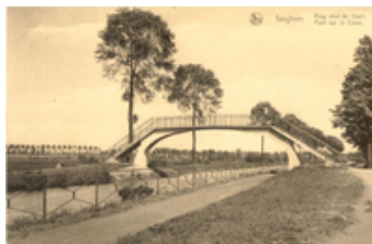
Afbeelding 9: meanderende Mandel