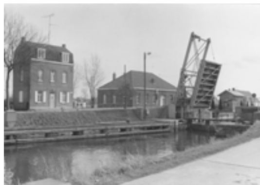
Afbeelding 5: Ophaalbrug Kachtem