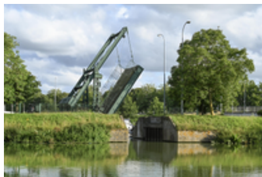
Afbeelding 6: Ophaalbrug Kachtem

Deze ophaalbrug overspande een smal sas dat een hoogteverschil van 70 cm (!) moest overbruggen.